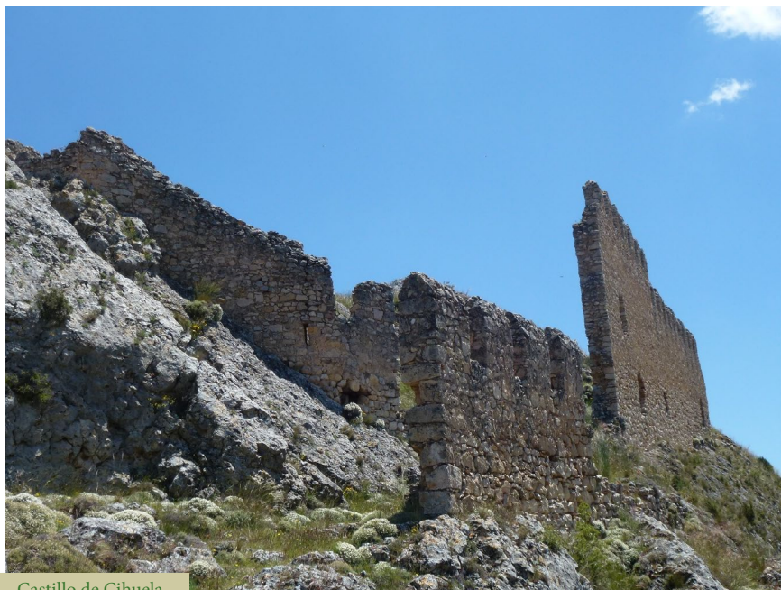
Castillo de Cihuela

En esta confluencia de caminos estaremos atentos a tomar el camino ancho de la izquierda o camino de la Corona, por el que cruzaremos la repoblación hasta el alto de