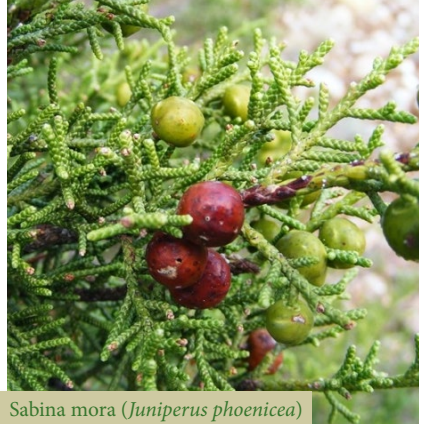
Sabina mora ( Juniperus phoenicea )

de Bordalba. En un corto trayecto más cruzamos el río Henar y accedemos a Deza, donde finaliza esta variante.